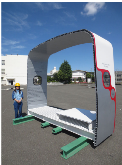
図1 試作した高速鉄道車両部分構体の外観写真